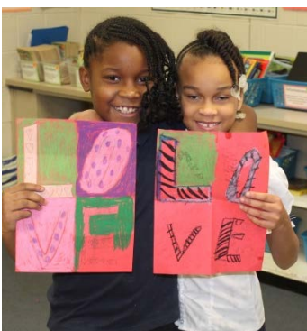
Students and volunteers from the Art from the Heart program!

Quinto Grado – "JA Nuestra Nación" provee información práctica sobre la necesidad de las empresas de individuos que puedan satisfacer las demandas del mercado de trabajo, incluyendo trabajos de alto crecimiento y alta demanda. Además, introduce el concepto de globalización del negocio en lo que se refiere a los materiales de producción y la necesidad de que los estudiantes sean emprendedores en su pensamiento para satisfacer los requisitos de carreras de alto crecimiento y alta demanda en todo el mundo.