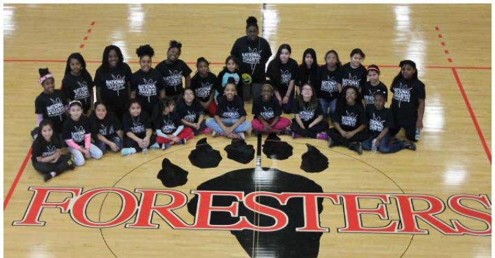
AJK Academy and Yeager Students at Lake Forest College celebrating the National Girls and Women in Sports Day!