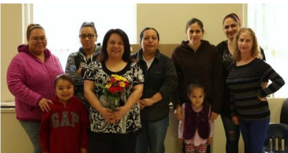
Parents and children alike have enjoyed the "Cafecito con Angela" workshops held at North school!