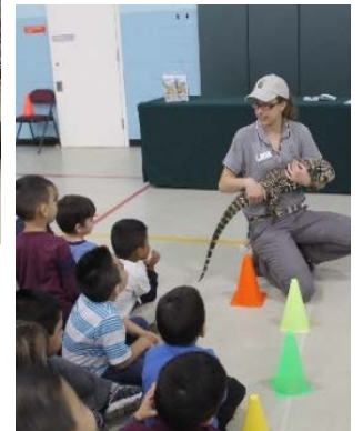
Students had so much fun meeting real life animals with the Wildlife Discovery Center!