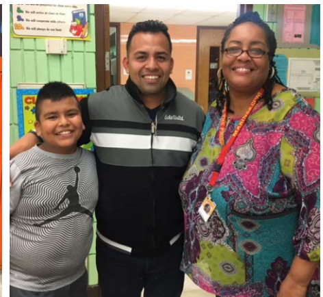
Snapshots of the fun school staff, parents and students had at the Open House!

¡Fotos que muestran todo lo que se divertieron los administradores de la escuela, padres y alumnos en la Casa Abierta!